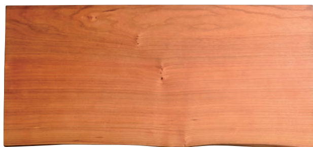
ダスホルツ サービングボードL ブラックチェリー JAN 4562191981774 W500×D250×H10(mm) ¥7,800(税抜) ¥8,580(税込)

人が集まる年末やお正月の他、ちょっとしたパーティ時にもご活用いただけます。サービングボードS、Mよりも板厚を5mm下げ、軽量に仕上げています。