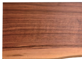
ダスホルツ サービングボードS ブラックウォルナット JAN 4562191981729 W250×D180×H15(mm) ¥3,800(税抜) ¥4,180(税込)