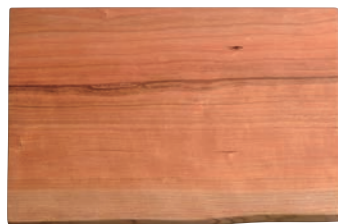
ダスホルツ サービングボードS ブラックチェリー JAN 4562191981736 W250×D180×H15(mm) ¥3,800(税抜) ¥4,180(税込)

片側部分に木肌を残し自然な曲線を生かしたサービングボード。季節を感じさせる旬の食材を生かした前菜やデザートなどにちょうど良いサイズです。