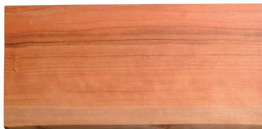
ダスホルツ サービングボードM ブラックチェリー JAN 4562191981750 W350×D170×H15(mm) ¥5,800(税抜) ¥6,380(税込)

横に広がるボードはより自然な木目や風合いが活かされ、オードブルやサンドイッチ、ケーキなどをすっきりと盛り付けます。