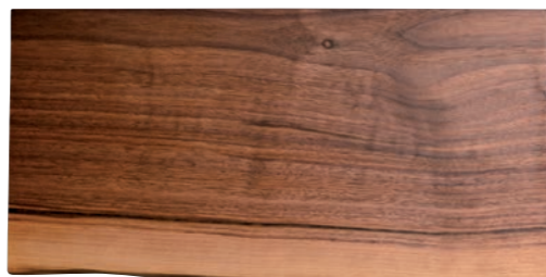
ダスホルツ サービングボードM ブラックウォルナット JAN 4562191981743 W350×D170×H15(mm) ¥5,800(税抜) ¥6,380(税込)