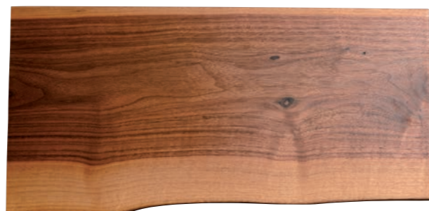
ダスホルツ サービングボードL ブラックウォルナット JAN 4562191981767 W500×D250×H10(mm) ¥7,800(税抜) ¥8,580(税込)